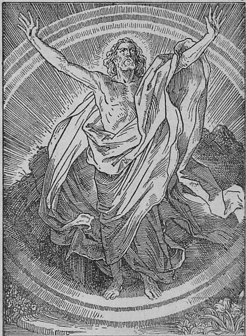
Hristos a biruit ! Hristos biruește ! El veșnic e biruitor !